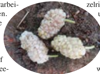
Die Früchte des weißen Maulbeerbaumes.