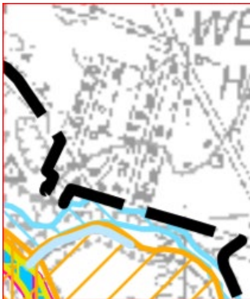
Abbildung 2: Übersichtskarte Lebensraumtypen und Arthabitate

Nach Anhang I+ II der FFH-RL und Anhang I VSch-RL werden folgende Arten im Wirkbereich des Plangebietes angegeben: