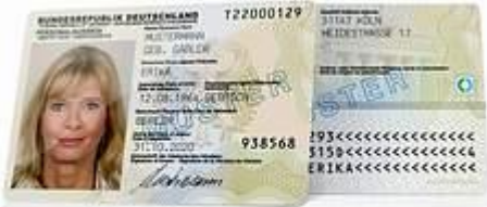
Muster neuer Personalausweis

Deutsche Staatsangehörige, die das 16. Lebensjahr vollendet haben und der allgemeinen Meldepflicht unterliegen, sind verpflichtet, einen gültigen Personalausweis zu besitzen; dies gilt nicht für Personen, die einen gültigen Reisepass besitzen und sich durch diesen ausweisen können.